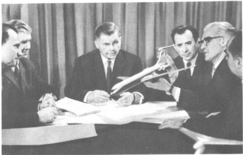
Первыми новый замысел С. В. Ильюшина обсуждают его ближайшие помощники.

С. В. Ильюшин много лет сам водил самолет. На снимке: Сергей Владимирович в кабине пилота.