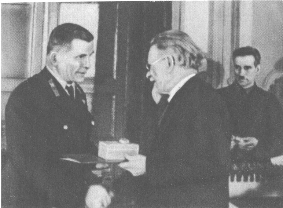
М. И. Калинин вручает в Кремле награду С. В. Ильюшину.