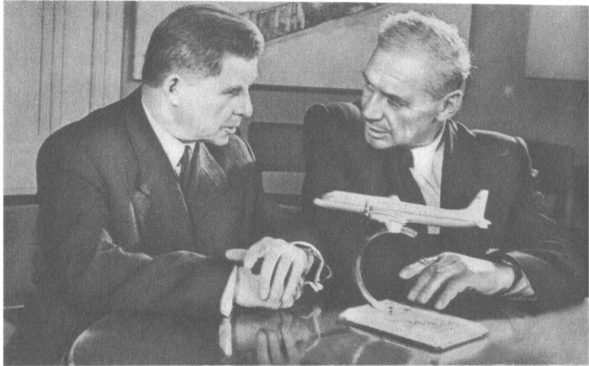
С. В. Ильюшин и В. К. Коккинаки.