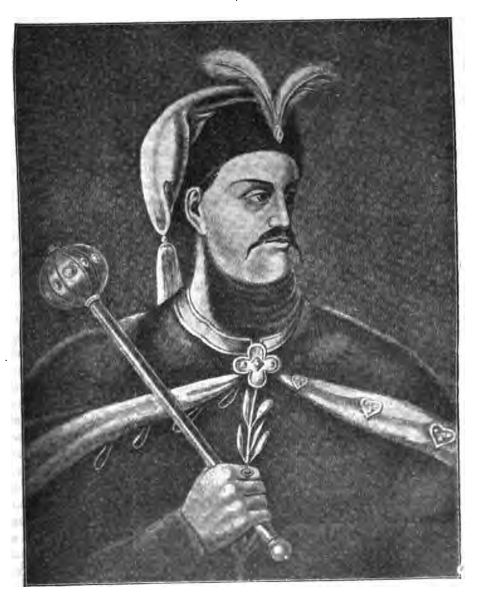
Гетманъ Петръ Дорошенко. † 1676 г.