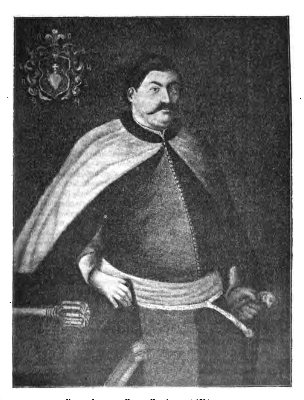
Наказной гетманъ Павелъ Полуботовъ. † 1724 г.