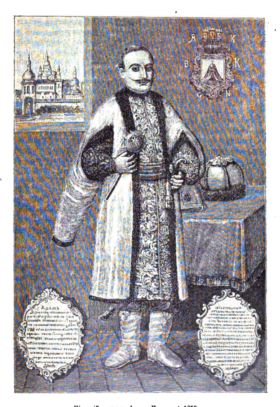
Кіевскій воевода Адамъ Кисель. † 1653 г.