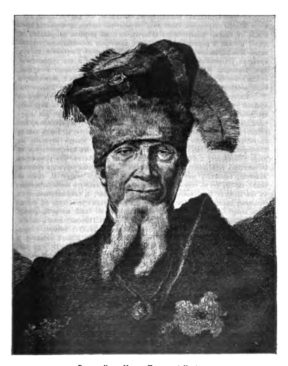
Гетманъ Иванъ Мазепа. По гравюръ Норблена.