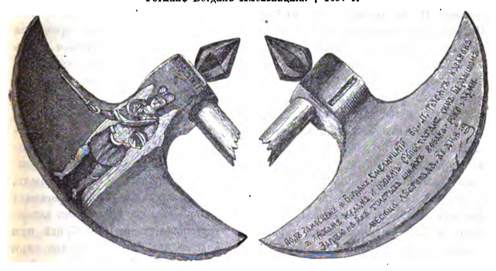
Бердышъ гетмана Богдана Хмельницкаго.