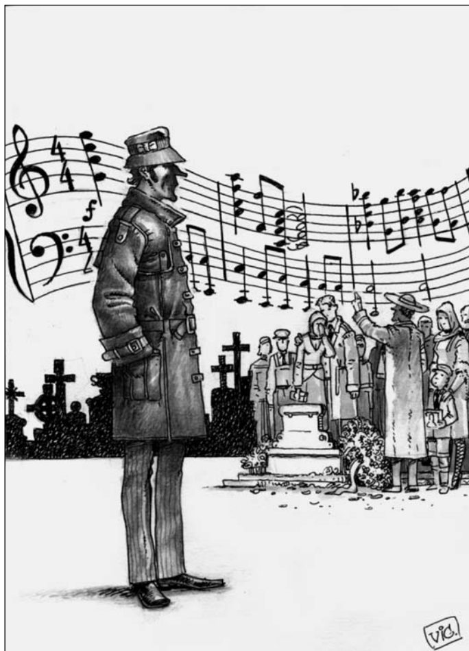
Иллюстрация Виктора БАЗАНОВА