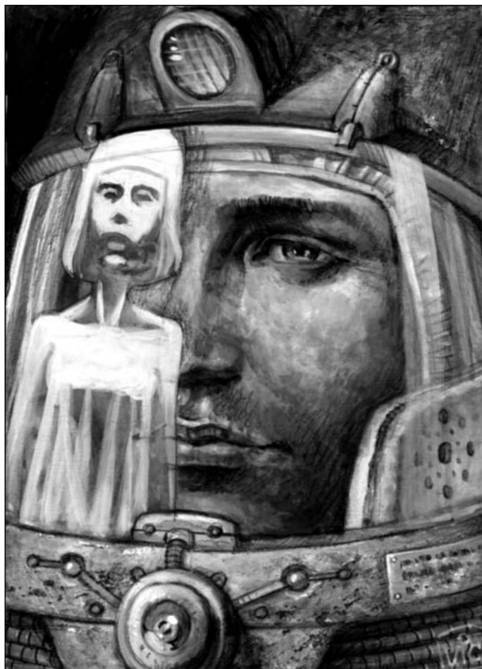
Иллюстрация Виктора БАЗАНОВА