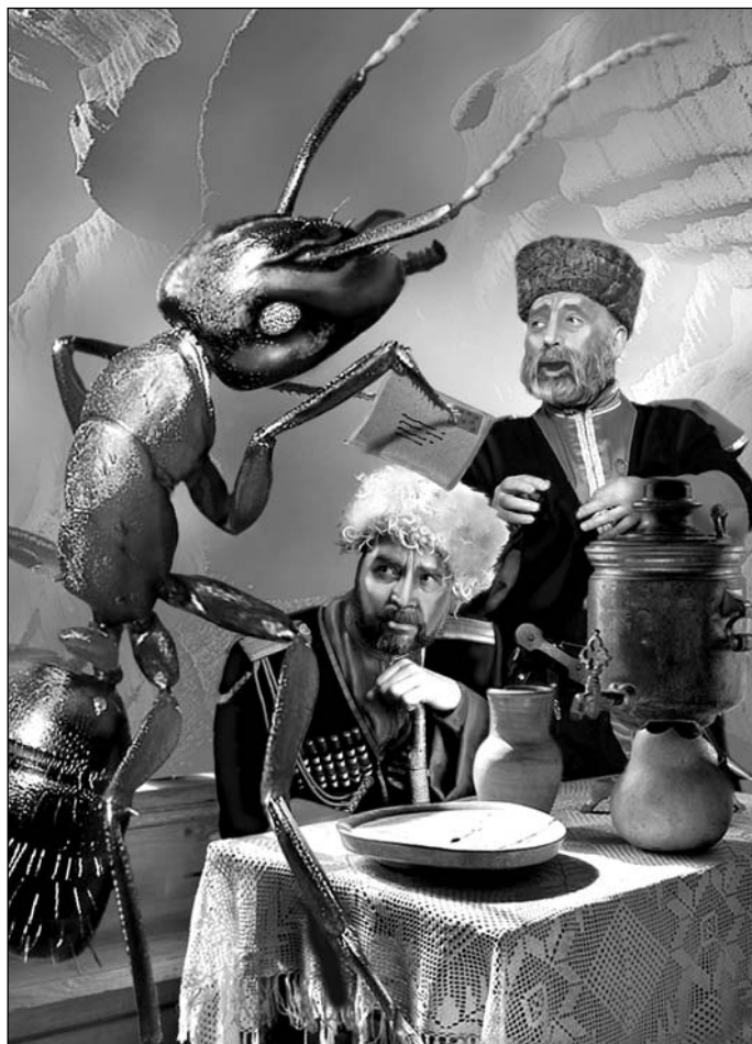
Иллюстрация Игоря ТАРАЧКОВА