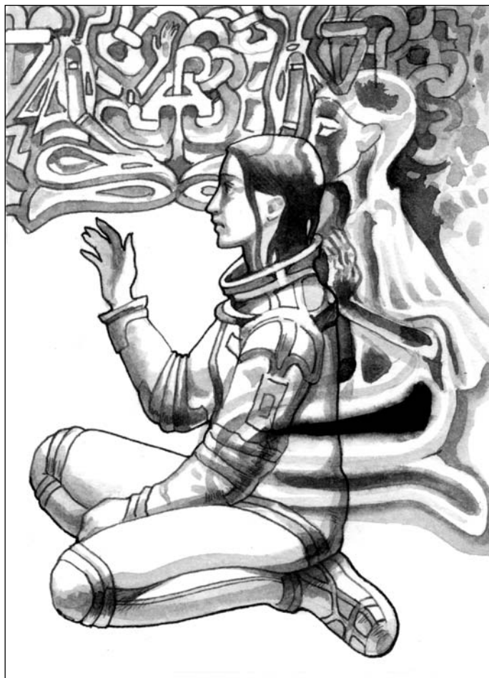
Иллюстрация Владимира ОВЧИННИКОВА