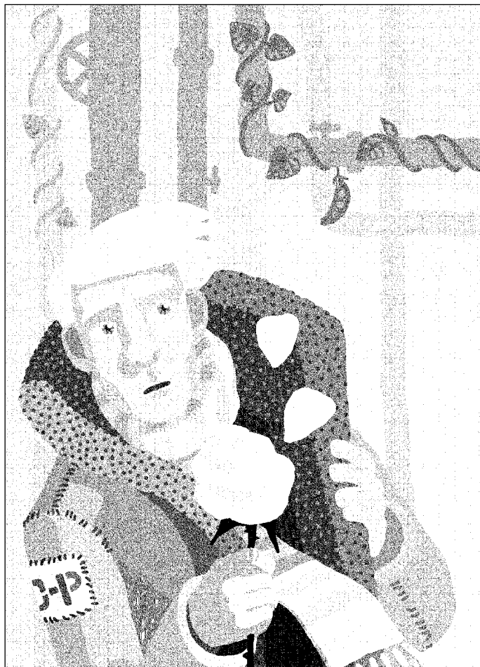
Иллюстрация Александра КУЗЬМИЧЕВОЙ