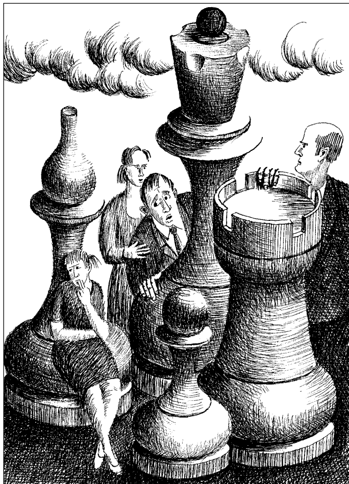
Иллюстрация Евгения КАПУСТЯНСКОГО