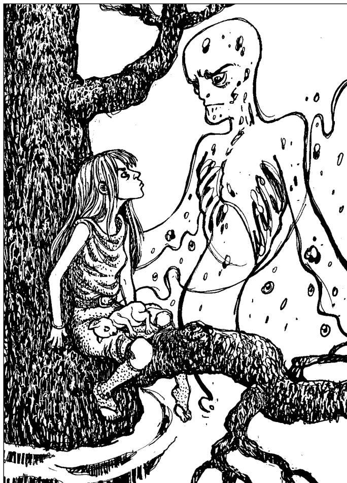
Иллюстрация Александра Кузьмичевой