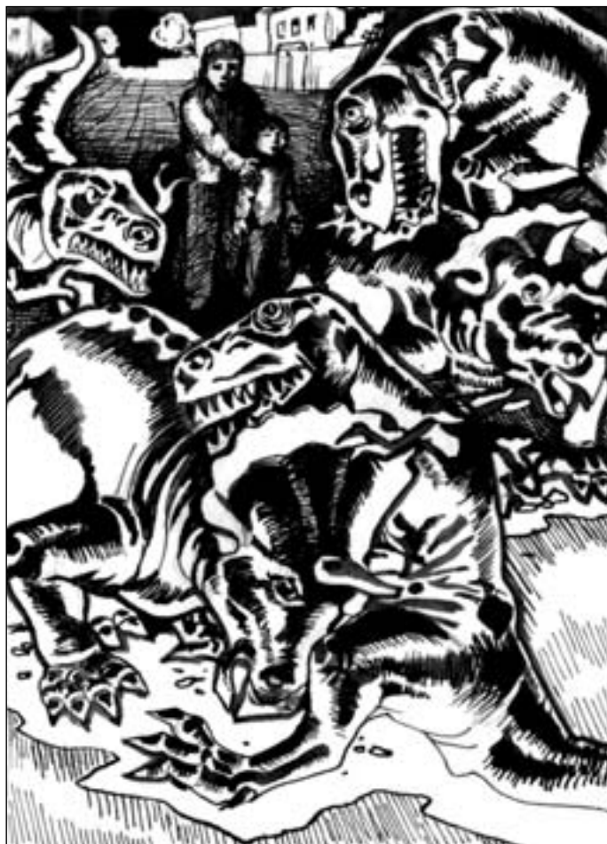
Иллюстрация Владимира ОВЧИННИКОВА