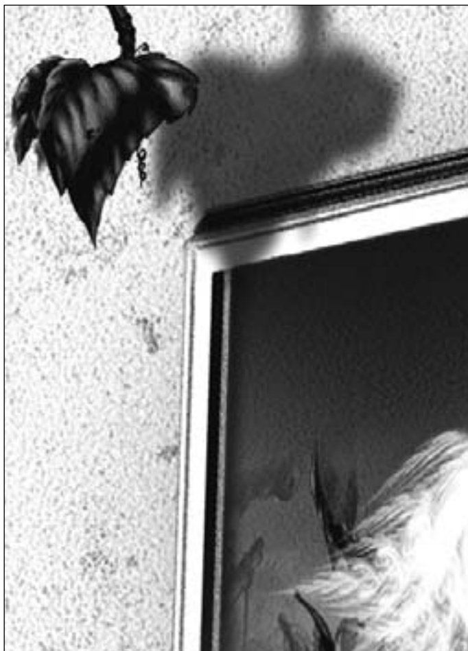
Иллюстрация Людмилы ОДИНЦОВОЙ