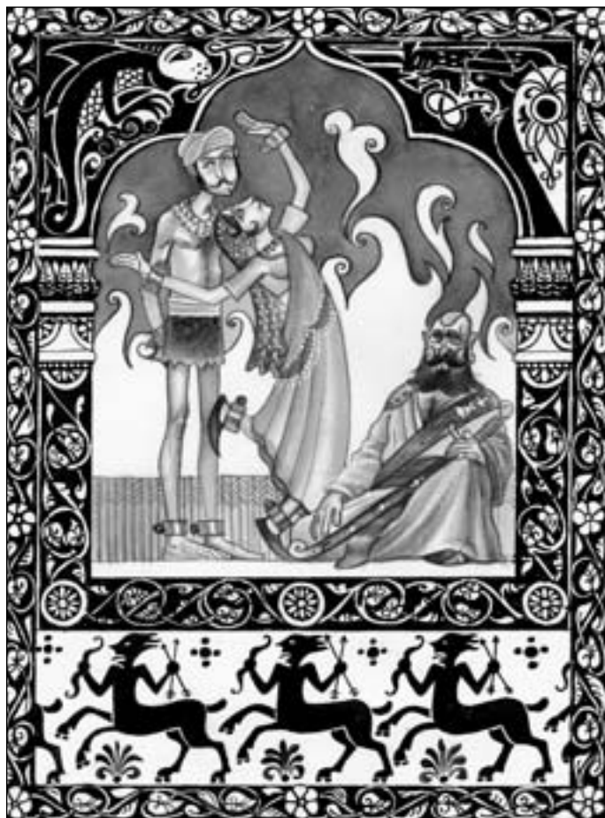
Иллюстрация Виктора БАЗАНОВА