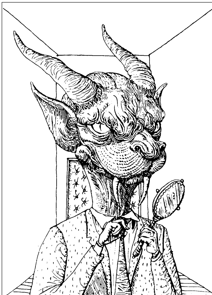
Иллюстрация Андрея БАЛДИНА