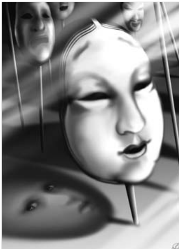
Иллюстрация Людмилы ОДИНЦОВОЙ