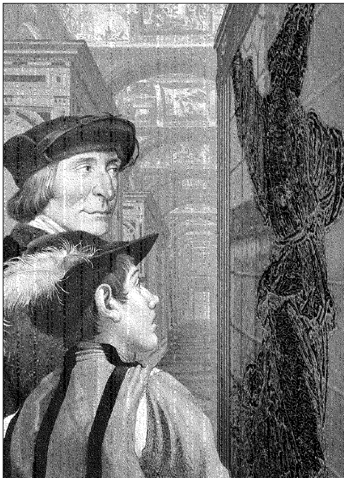
Иллюстрация Сергея ШЕХОВА