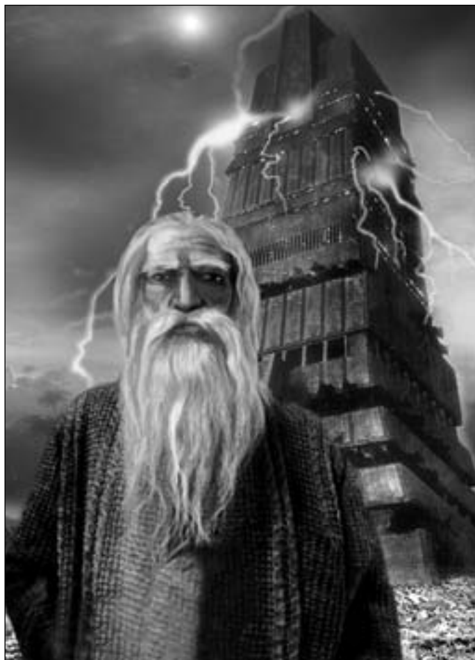
Иллюстрация Игоря ТАРАЧКОВА