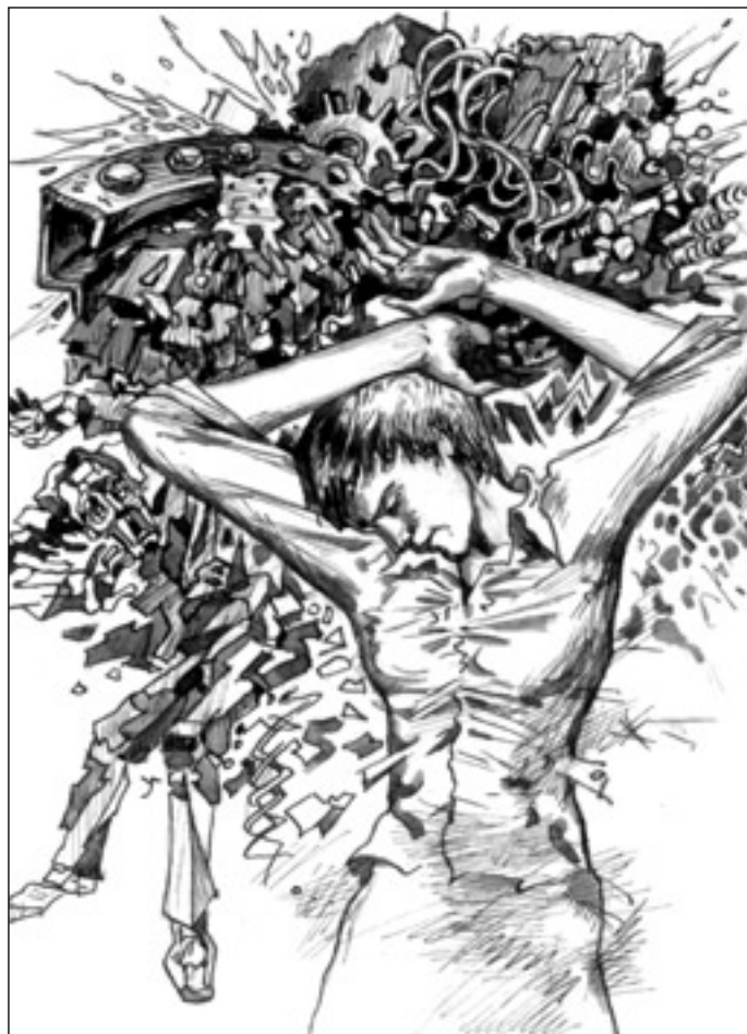
Иллюстрация Владимира Овчинникова