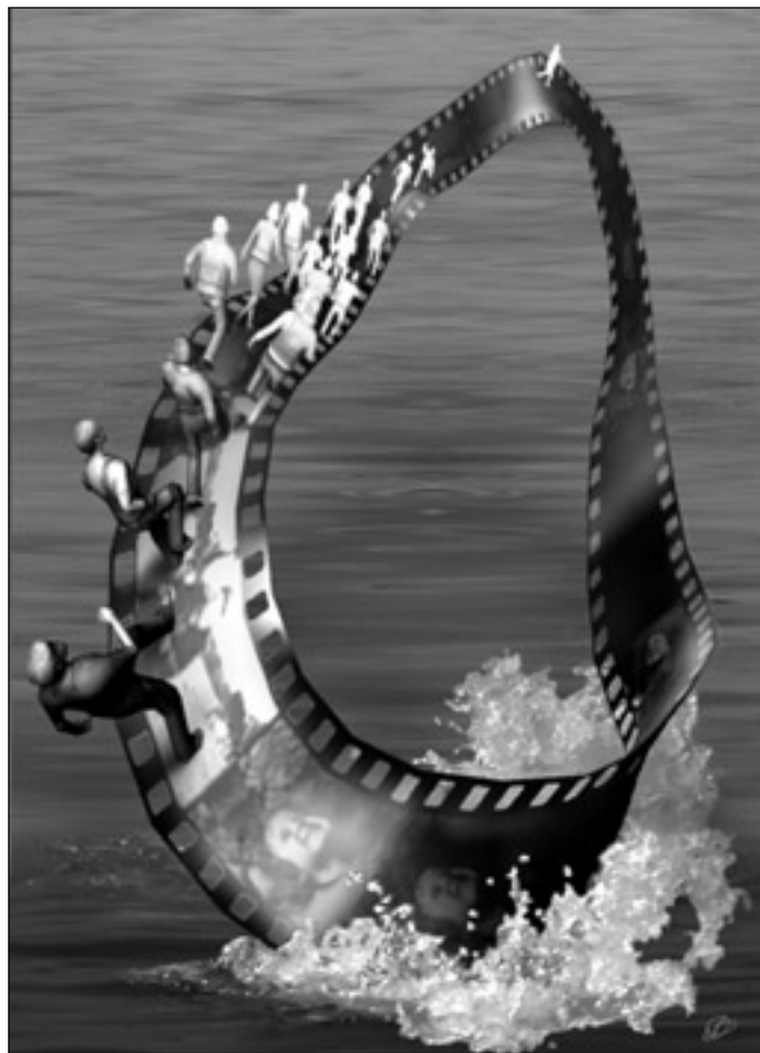
Иллюстрация Людмилы ОДИНЦОВОЙ