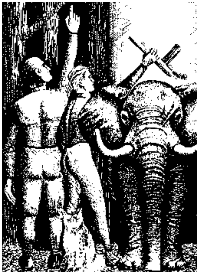
Иллюстрация Евгения КАПУСТИЯНСКОГО