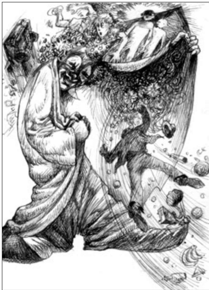
Иллюстрация Владимира Овчинникова