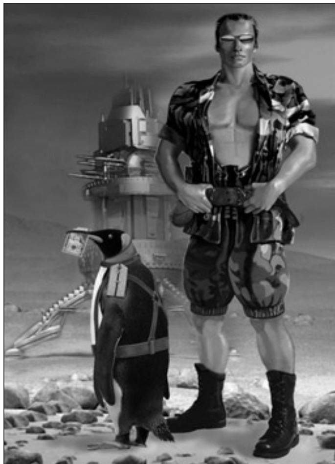
Иллюстрация Игоря ТАРАЧКОВА