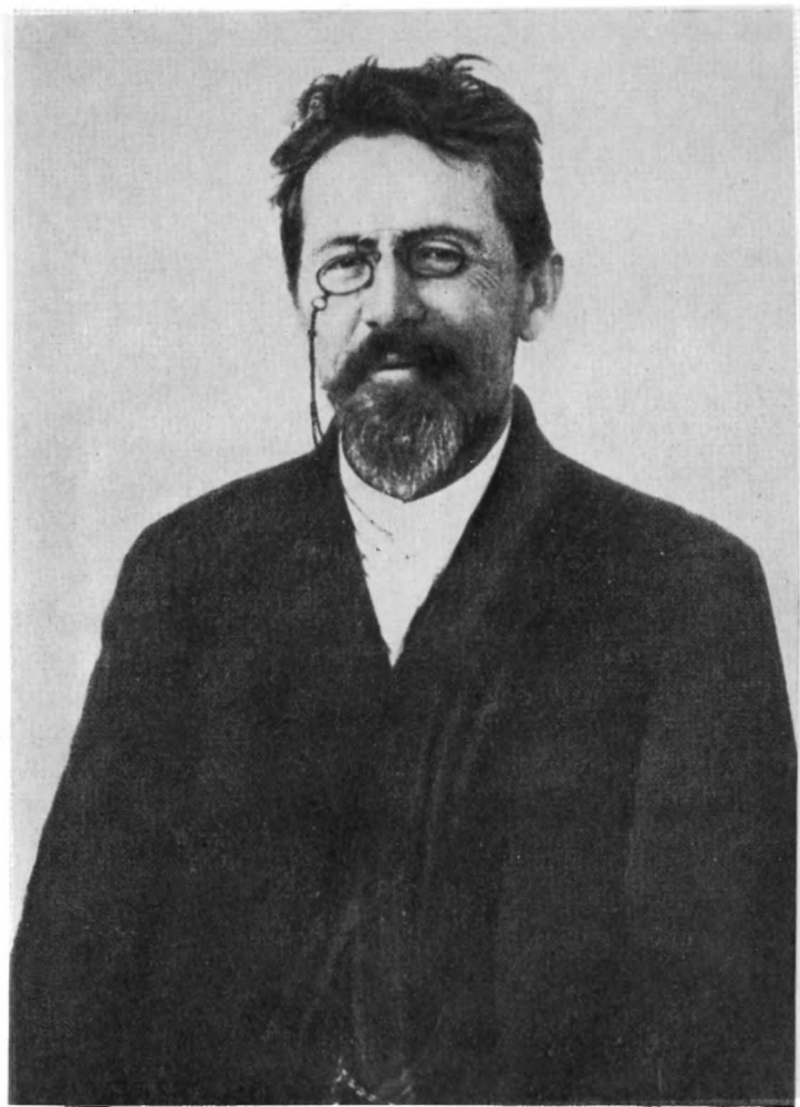
А. П. ЧЕХОВ Фотография 1902 г. Ялта