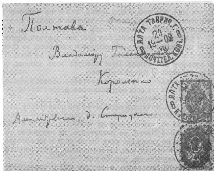
КОНВЕРТ ПИСЬМА к В. Г. КОРОЛЕНКО от 25 АВГУСТА 1902 г.

В декабре прошлого года я получил извещение об избрании А. М. Пешкова в почетные академики; и я не замедлил повидаться с А. М. Пешковым, который тогда