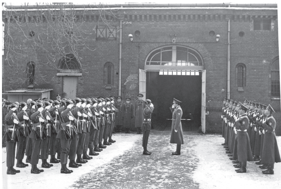
Смена караулов по охране Межсоюзной тюрьмы Шпандау

Опасно! Не приближаться, караул будет стрелять».