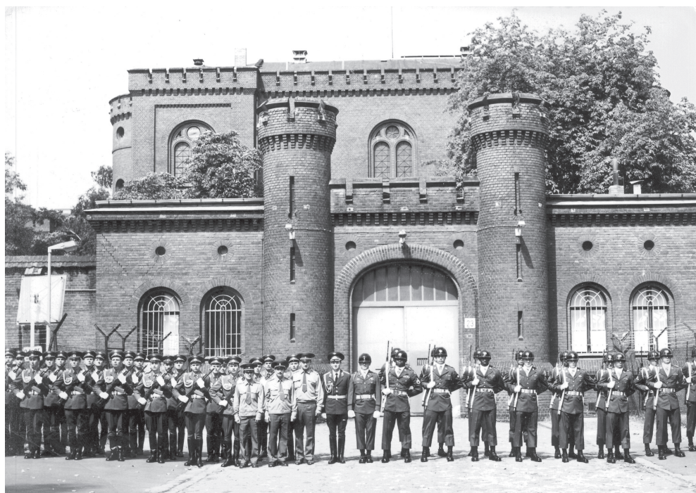
Советские и американские солдаты на фоне ворот тюрьмы Шпандау

Уставом тюрьмы было определено, что заключенный имел право написать и получить одно письмо в неделю. Письма должны были быть написаны на немецком языке, разборчиво, без шифра или стенографических знаков. Не разрешалось ничего подчеркивать, использовать сокращения. Не разрешались изображения знаками без их расшифровки. Письма для цензуры должны были подаваться в открытом виде.