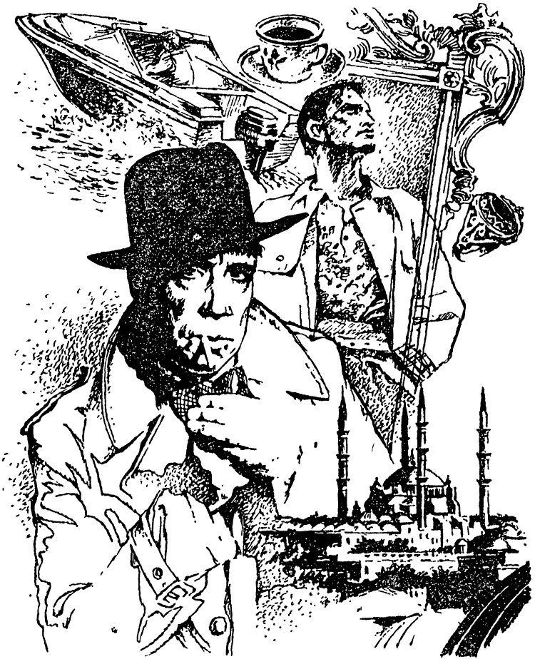
Рисунки В. РОДИНА.