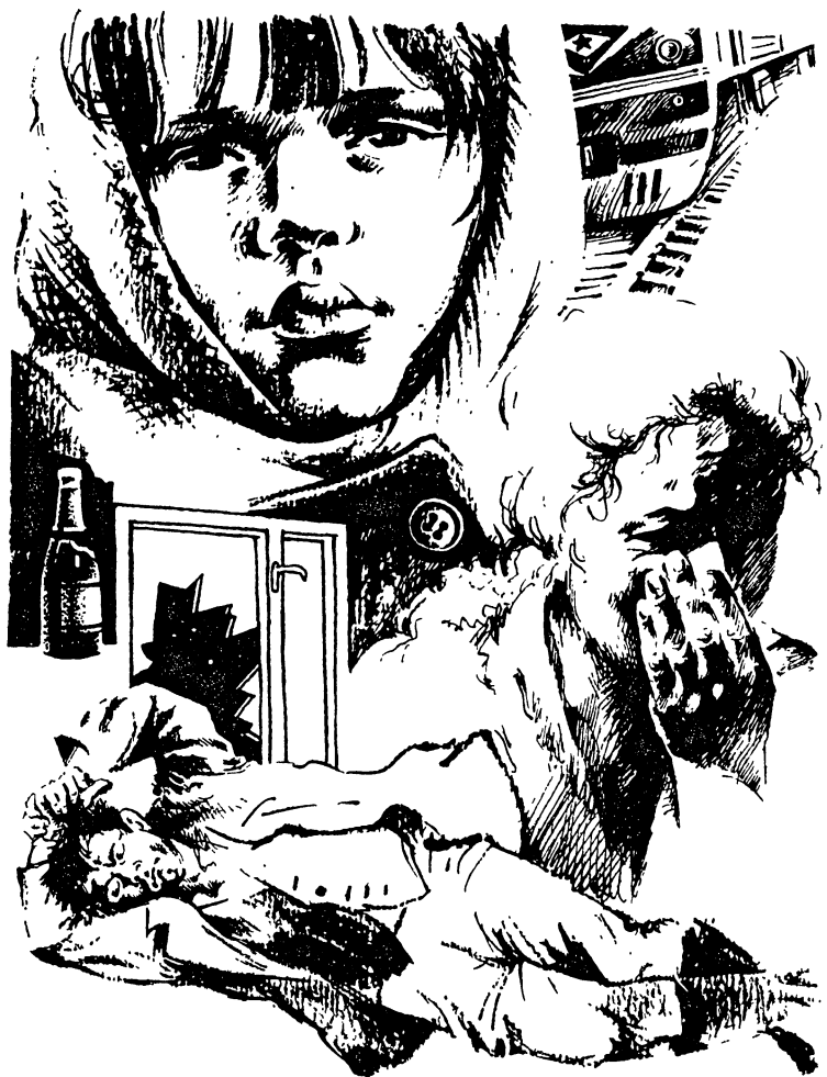
Рис. В. Родина

— Правда, подруга, повремени немного. Голова прям раскаляется, поясницу сегодня у меня утром еще разломило, кабы не рассыпаться. Что за день сегодня, господи, не знаю.