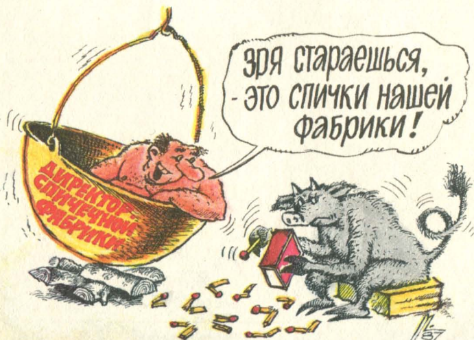
Рисунки К. Мальцева г. Челябинск