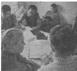
А это эпизоды из студенческих будней...