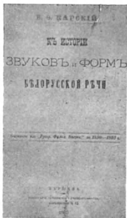
Первая книга Е. Ф. Карского «Обзор звуков и форм белорусской речи» (Москва, 1886)