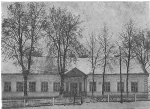
Восьмилетняя школа на родине Е. Ф. Карского — в с. Лаща Гродненского района БССР

жал на историко-филологическом факультете Варшавского университета магистерский экзамен, а в 1893 г. был назначен преподавателем русского языка в этом учебном заведении. Вступительная лекция, которая была прочитана ученым 27 февраля того же года, посвящалась истории русского литературного языка.