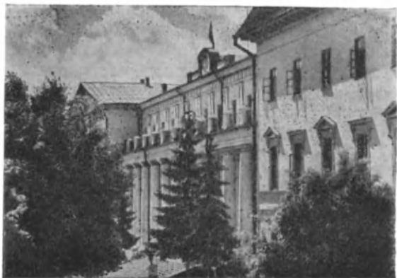
Восстановленное здание Нежинского историко- филологического института (ныне педагогический институт)

ческой деятельности А. С. Пушкина на развитие русского литературного языка» 10 , в 1901 г. выпустил в свет книги «Образцы славянского кирилловского письма с X по XVIII век» и «Очерк славянской кирилловской палеографии», за которые Российская академия наук 29 декабря того же года наградила его малой Ломоносовской премией. Одновременно с этим он был избран членом-корреспондентом по Отделению русского языка и словесности.