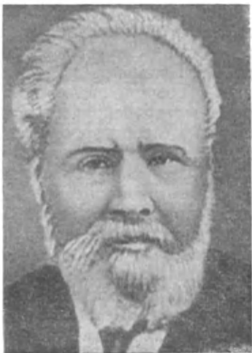
Е. Ф. Карский

решения лингвистических задач, также данные истории, археологии, этнографии, палеографии и других отраслей знания.