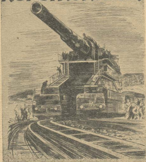
Так выглядела пушка «Дора» (по рисунку из немецкого журнала).

Все другие виды осадной артиллерии оказались бес- сильными против русских башенных батарей, хотя, по сло- вам Манштейна, помимо еще двух 24-дюймовых мортир, под Севастополем было несколько сот тяжелых орудий ка- либром 11, 12, 14 и 16 дюймов.