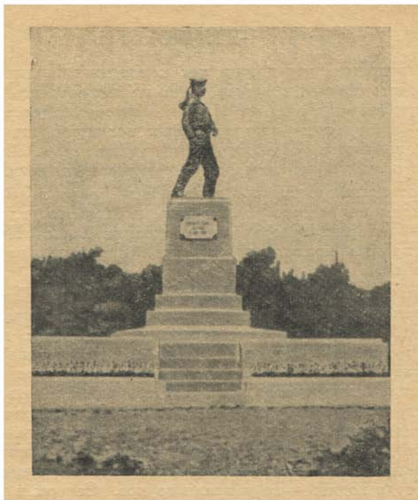
Памятник на могиле воинов Тридцатой батареи.

вато-синее. На небольшой волне идут кильватерным строем курсантские баркасы, распустив паруса «бабочкой».