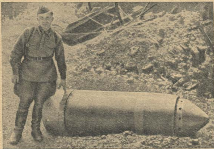
Неразорвавшийся снаряд 610-мм мортиры.