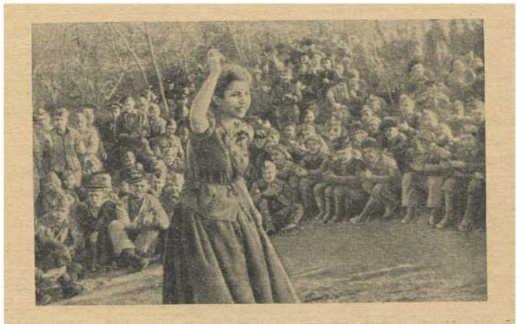
Концерт в районе батареи.

брошен восьмой авиакорпус генерала Рихтгофена — опытного фашистского летчика. Его асы бомбили Лондон, Ковентри, Бирмингем, штурмовали английские войска в Ливии. Это был цвет фашистской авиации. Около тысячи различных самолетов приготовили гитлеровцы для штурма. Количество артиллерии под Севастополем утроилось.