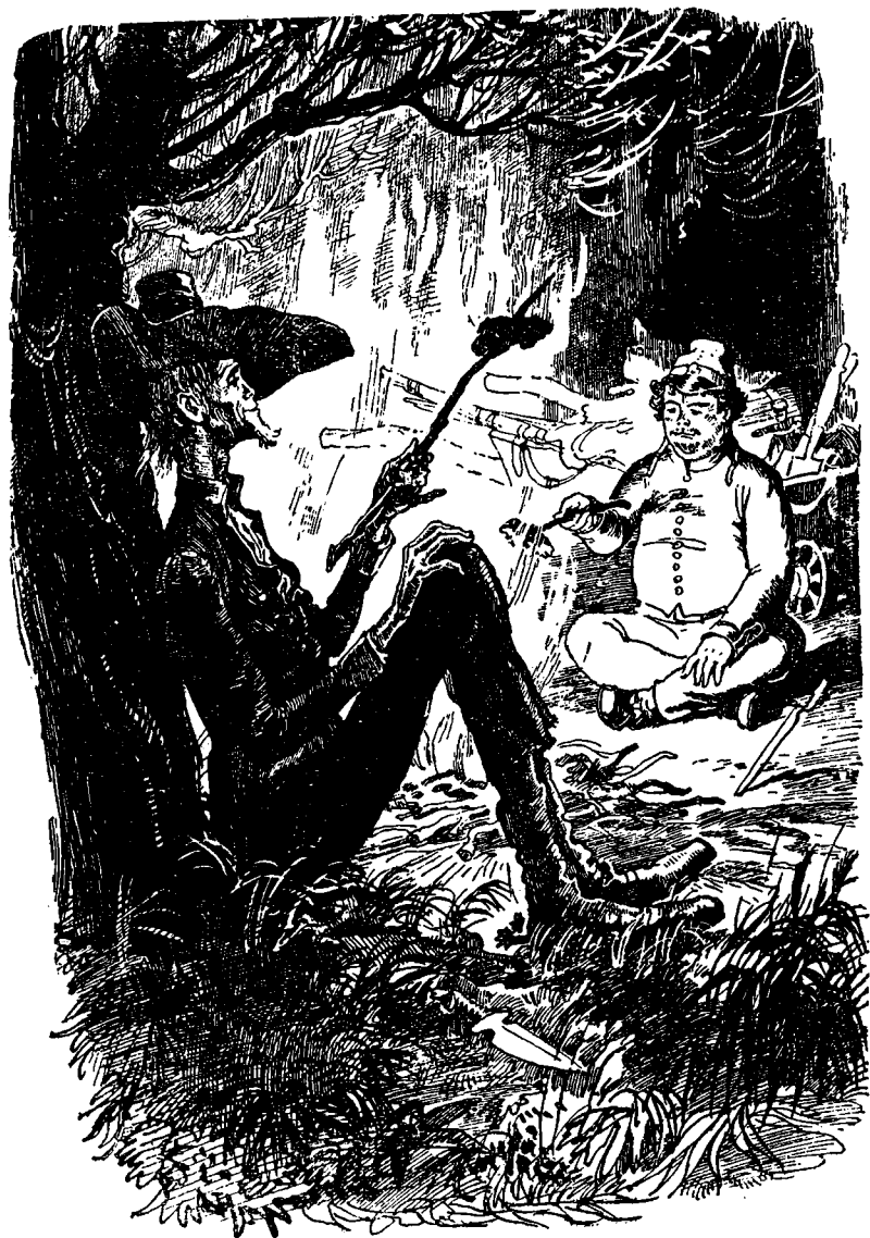
Прятели были заняты приготовлением ужина.