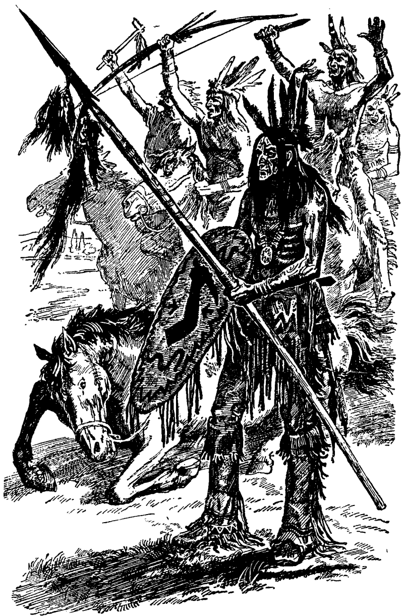
Лошадь Кровавой Руки билась на траве, а сам он стоял рядом.