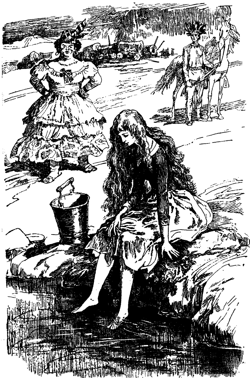
Длинные волосы Лилиен касались травы, одну ногу она опустила в воду.