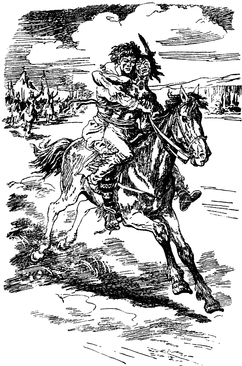
На крупе лошади был Френк Уингроув, а впереди него — воин арапахо.