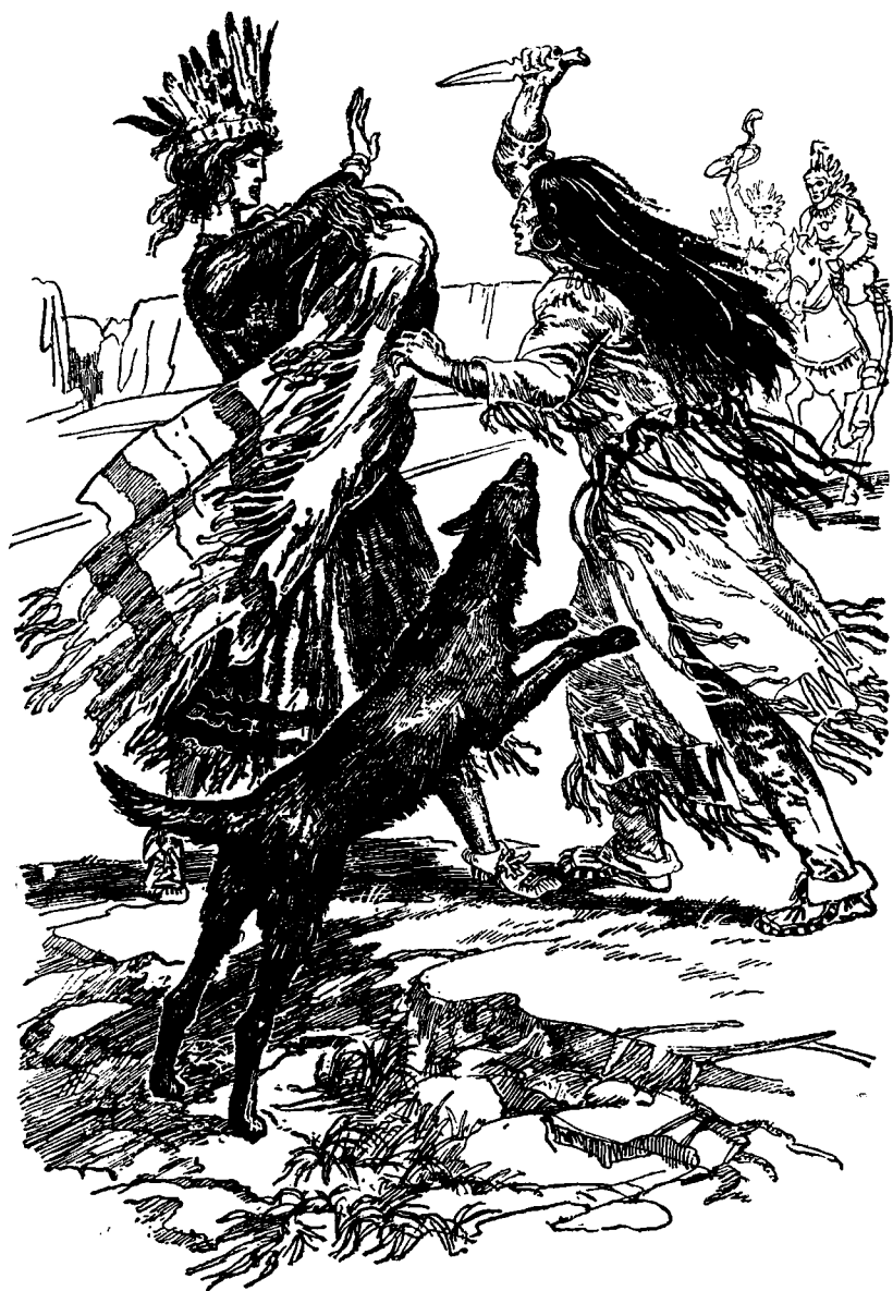
Су-ва-ни ринулась с ножом на соперницу...