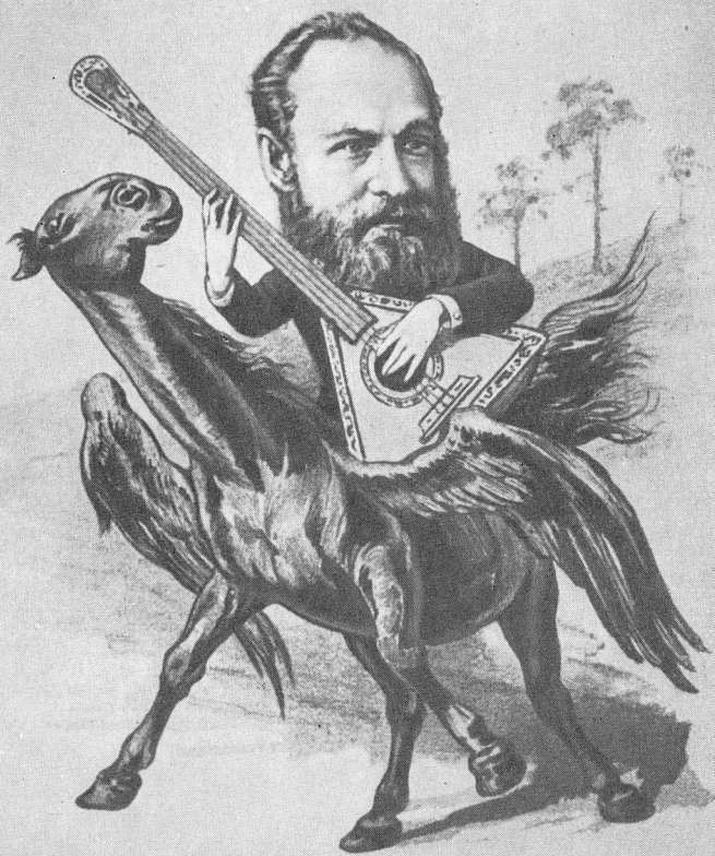
Рис. Н. И. Дальскаго.